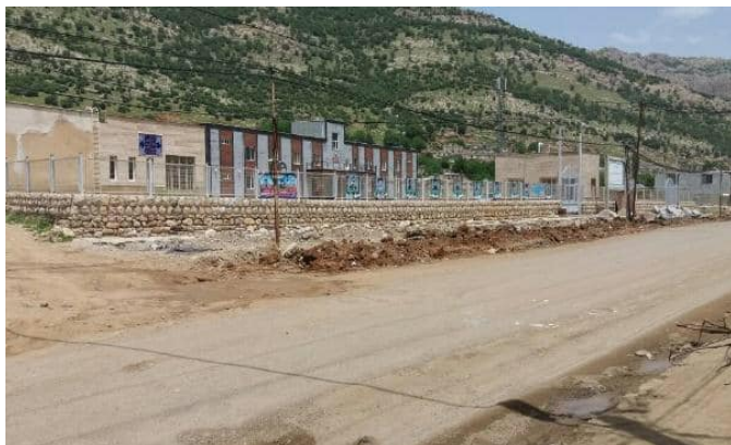
Wêne 2. Abîdeya Şehîdan, Dezli/Kurdistan

Rejimê, li Kurdistanê siyaseta demografîk a piralî jî daye meşandin. Bi vê siyasetê, pêşî hin projeyên xaniçêkirinê da destpêkkirin ku ji aliyê stratejîk ve hêzên xwe yê ne-aidî wir, personelên ewlehiyê û rêvebirên ne-ji wir li seranserê herêmê bi cî bike.