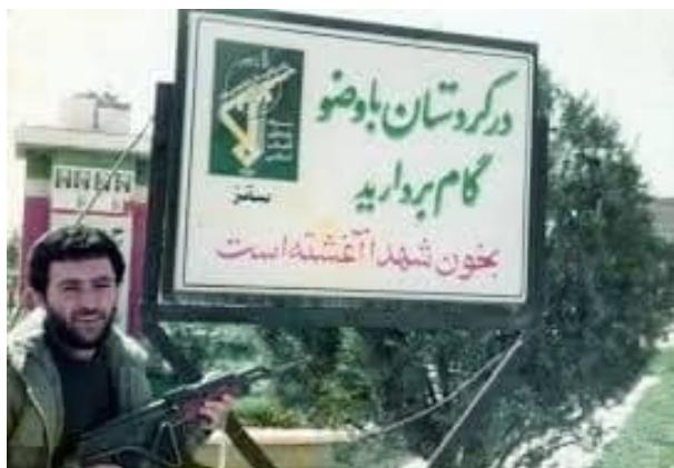
Wêne 1. Levhayêke berbelav li ser rê, dibêje 'Beriya pê li axa Kurdistanê biki, destmêj bigre, ew bi xwîna şehîdan şil bûye' ( http://www.daliranekordestansaghez.com/dnkht.aspx ).

Di gotara Kîlî de, dagirkirina leşkerî û biewlehîkirina Kurdistan Rojhilat gelek caran wek fetha Kurdistanê tê îşaretkirin (bnr. wêne 1). Ev têgeh îmayek wê pir xurt a dînî heye û diçe heta fetha Mekeyê û hilweşandina pûtperesetiye ji aliyê pêxemberê Îslamê di 629 P.Î. de. [6] Fetha Kurdistanê di Tebaxa 1979an de bi îlana Humeynî ya cîhada li dijî Kurdistanê dest pê kir (bnr. Cabi 2015, 61–9). Miameleya Kîlîyê li dijî Kurdan û dîroka stratejiya dewletê di merhaleyên cuda de bi awayên cuda dikare bê formulekirin. Lê xetên sereke yên siyaseta dewletê li hemberî civatên bindest neguherîn (w.m. Ereb, Belûcî û Kurd).